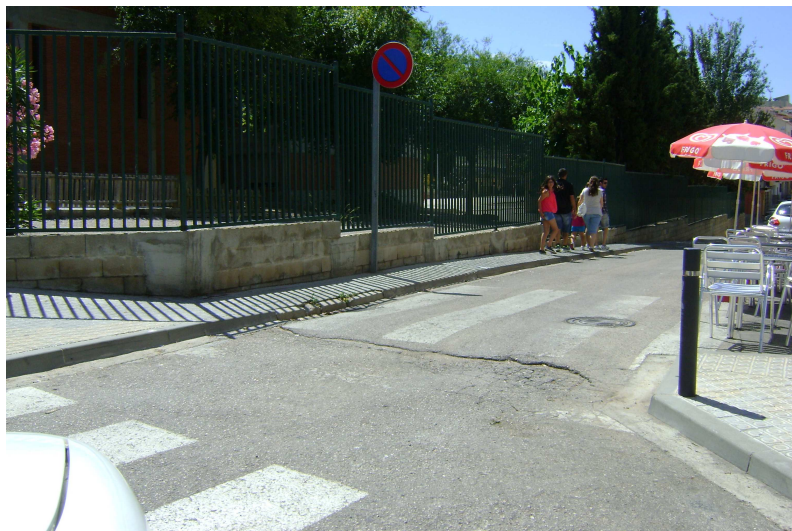
Carrer Barcelona cantonada carrer Miquel Servet