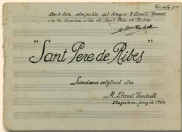
Portada de la sardana "Sant Pere de Ribes" de M. Llorent Vendrell.

Al llarg de la recerca per a la redacció d'aquesta separata, han sorgit obres dedicades a Ribes de compositors autòctons o d'altres indrets que fins ara havien restat en l'oblit a l'espera d'una reestrena, d'ençà del primer cop que van ser interpretades. Mereixen, per tant, un apunt individual i la imatge que il·lustra el fet.