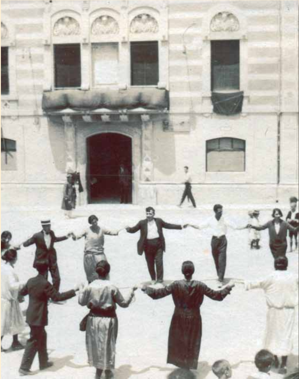
Ballada de sardanes el dia de Sant Pere de l'any 1922 a la plaça de la Vila.

Per primera vegada a la història, les sardanes havien de justificar-se davant dels republicans, suportant els seus atacs. Lerroux lligà de forma hàbil els moviments obrers amb l'anticatalanisme. Carregar contra les sardanes va passar a ser una forma de construir una determinada consciència obrera que tergiversava demagògicament les accions i activitats culturals de caire catalanista. Ballar sardanes, al mateix temps, es va convertir en una demostració política amb la voluntat de recuperar i generar quelcom propi.