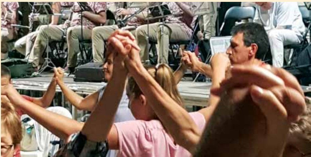
Sardanes a la Plaça Marcer l'estiu del 2018.