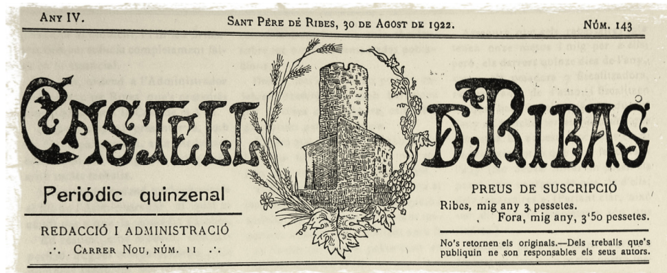
Capçalera del Castell de Ribas, periòdic quinzenal que es publicà a Ribes des de l'any 1916 fins al 1919 i del 1922 al 1923 amb informacions bàsicament locals.