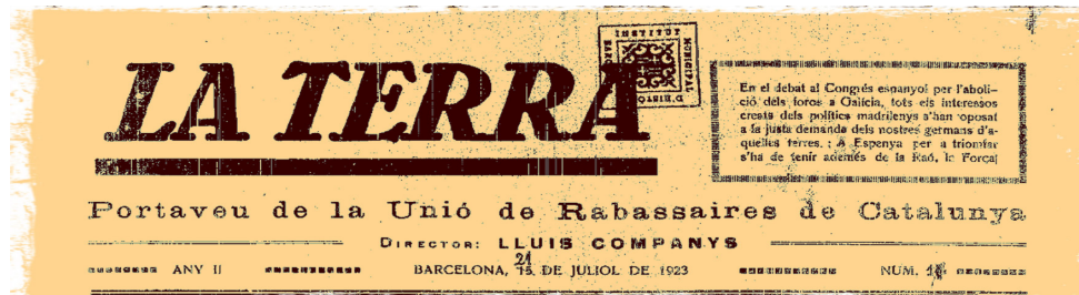
Capçalera de La Terra (1922-1939) òrgan oficial de la Unió de Rabassaires que dirigia Lluís Companys

En les eleccions municipals de l'any 1920 es presenta per primera vegada a Sant Pere de Ribes una candidatura formada per persones de la Societat d'Agricultors i Obrers. Recordem que en aquelles eleccions es renovaven la meitat dels regidors del ple municipal, format per 10 regidors.