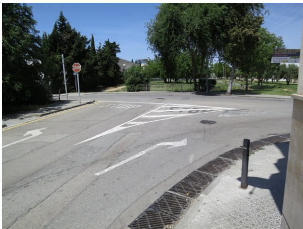
Cruïlla amb carrer Agricultura.