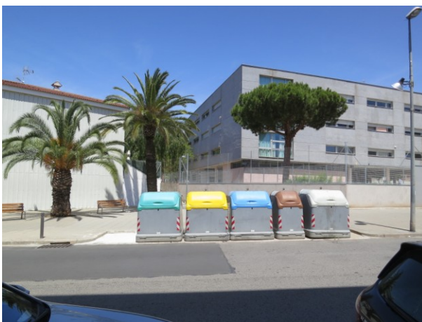
Presència de contenidors de brossa