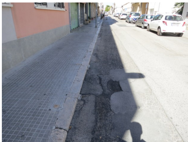
Asfalt en mal estat a l'alçada del número 50