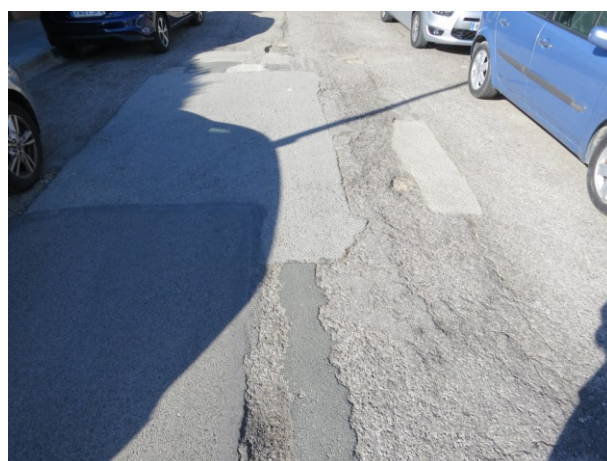
Detall d'asfalt en mal estat.