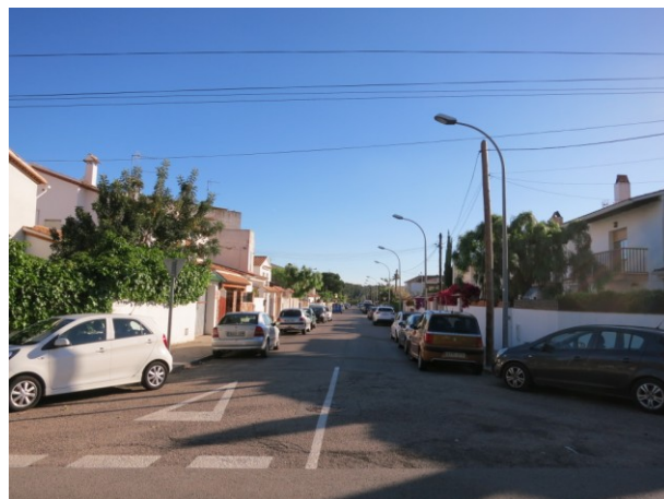
Visió general del carrer Guillem I de Ribes