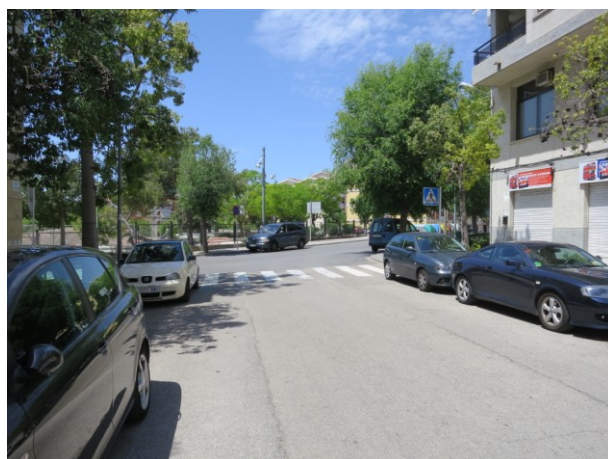
Tram final de Cid Campeador, arribant a Eugeni d'Ors