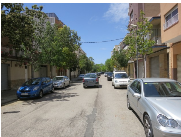
Asfalt apedaçat per treballs de manteniment anteriors.