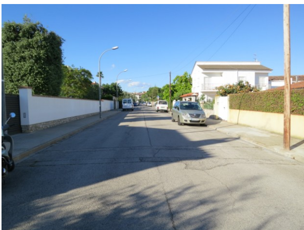
Detall del mal estat de l'asfalt.