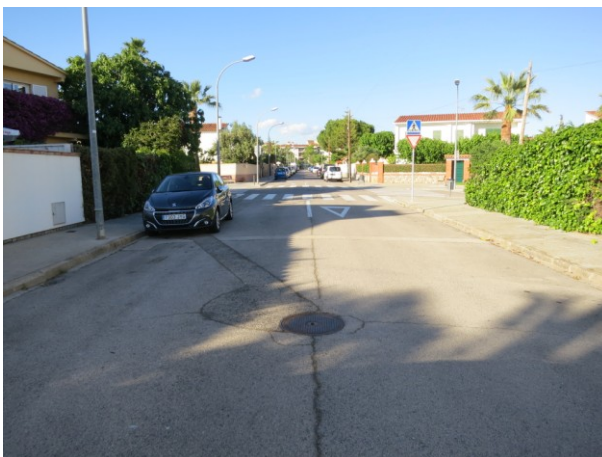
Detall d'un asfaltat parcial fruit d'una actuació anterior