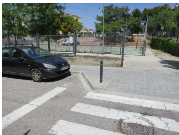
Gual de vianants executat en una actuació anterior.