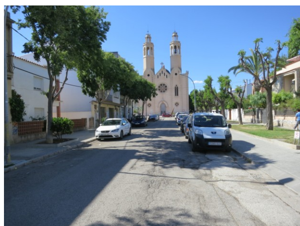
Asfalt en mal estat