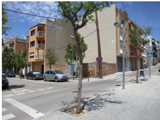
Carrer Sagunto cruïlla amb carrer Cid Campeador