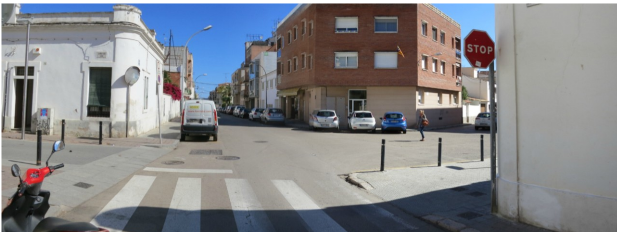
Carrer Jaume Balmes cantonada amb carrer Nou