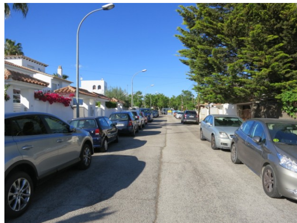
Junt de construcció desgastat per l'ús