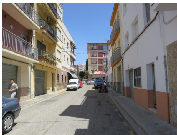
Marques longitudinals a repintar