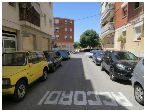
Senyals viària pintades sobre la calçada. Un cop re asfaltat el carrer seran repintades