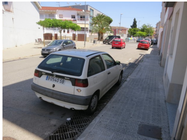
Embornals de grans dimensions a tot l'àmbit.