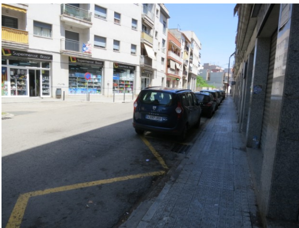
Marques longitudinals en Zig-zag.