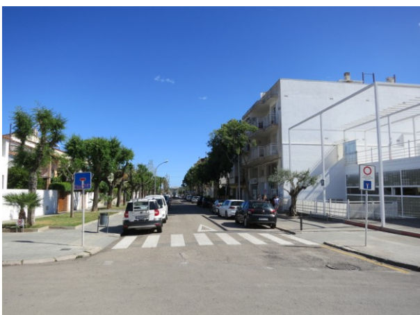
Vista des del Carrer Eduard Maristany