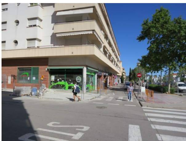
Senyals viàries pintades a la calçada