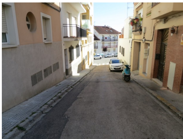
Recorregut a través del Carrer Sant Ramon en sentit Nord-Sud 2