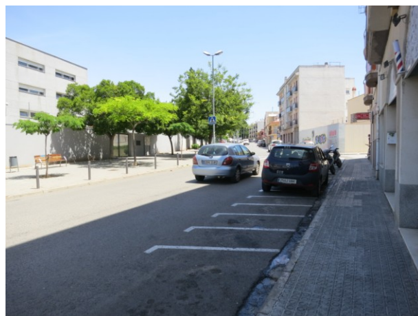
Places d'aparcament per a motocicletes.