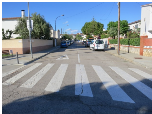
Pas de vianant i senyal viària pintada a la calçada