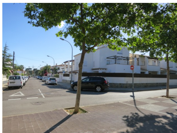
Arribada de l carrer Ausiàs March al carrer Sitges