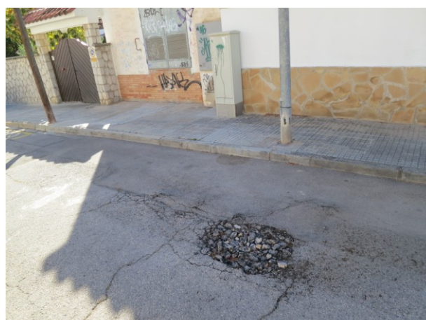
Localització i Detall d'un sot a l'asfalt. Davant parcel·la número 23A