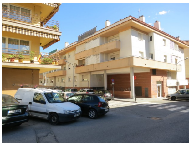
Vista de l'asfalt escrostonat i d'una tapa de clavegueram.