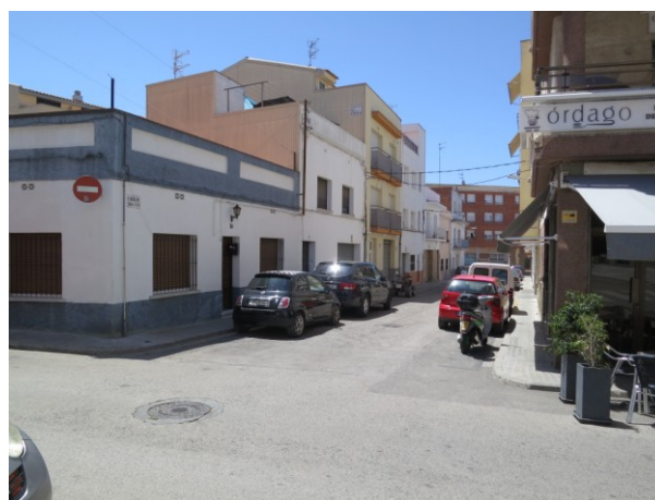
Vista des del carrer Antoni Gaudí