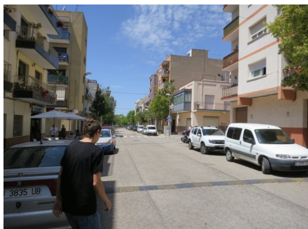
Bandes Rugoses preexistents. Caldrà retirar-les abans d'asfaltar