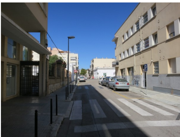
Vista de la finca número 37