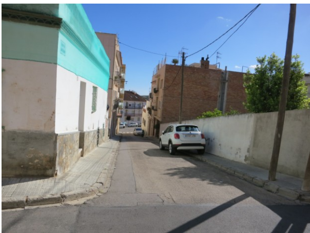
Recorregut a través del Carrer Sant Ramon en sentit Nord-Sud 1