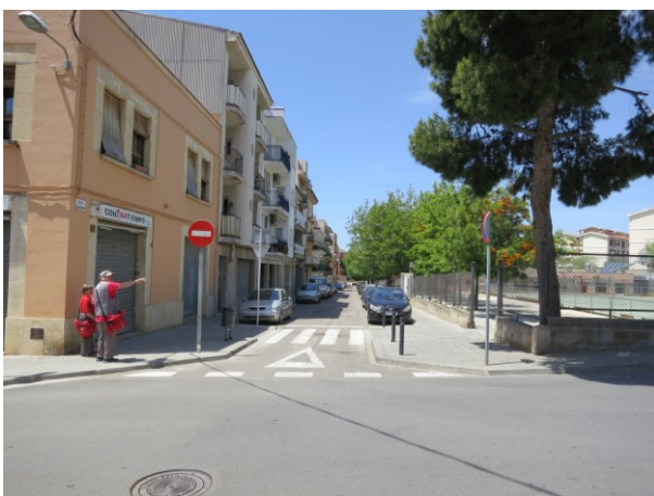
Vista des del Carrer Eugeni d'Ors