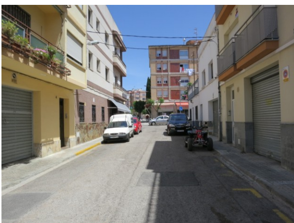
Vista general del carrer Joan XXIII