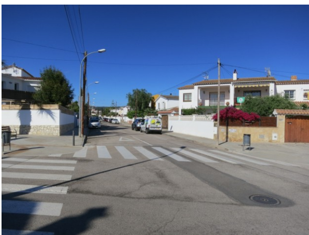
Detall d'un asfaltat parcial fruit d'una actuació anterior