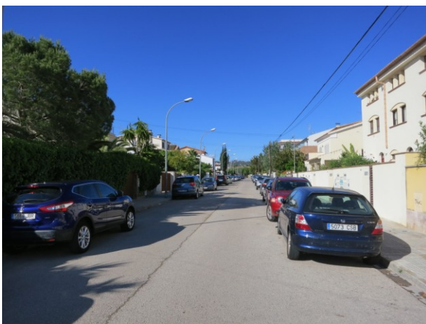
Localització i Detall d'asfalt en mal estat