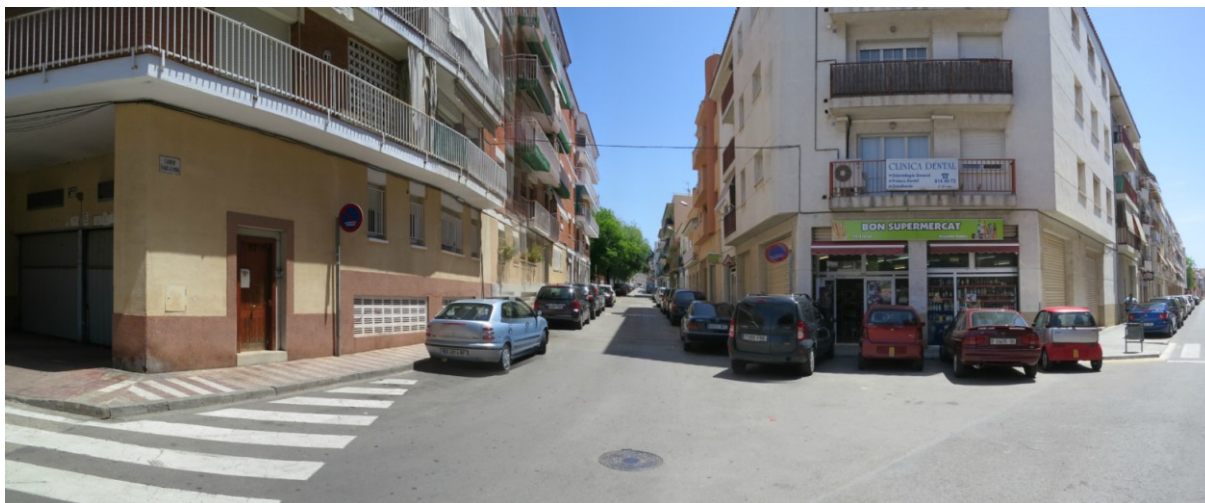
Vista des del carrer Ortega i Gasset