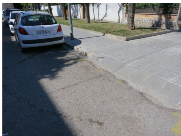
Gual preexistent a repintar