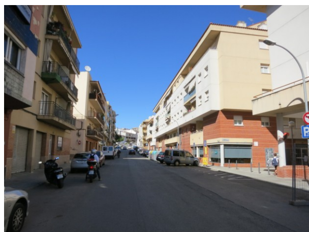
Visió general del carrer Lluís Companys