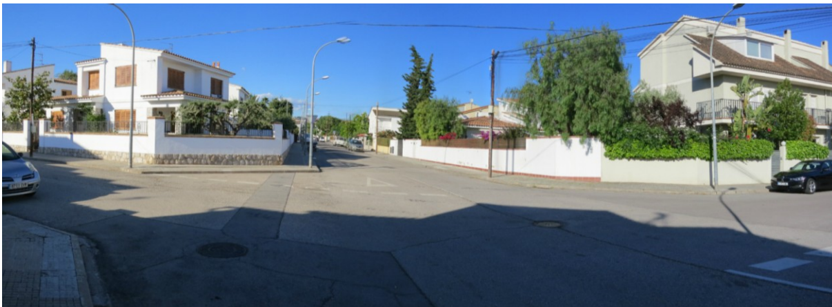
Vista del Carrer Guillem I de Ribes des de la cruïlla amb el carrer Jaume Balmes.