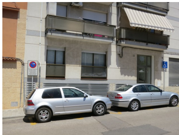
Plaça d'aparcament per a Persona amb Mobilitat Reduïda