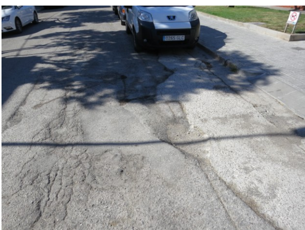
Asfalt en mal estat