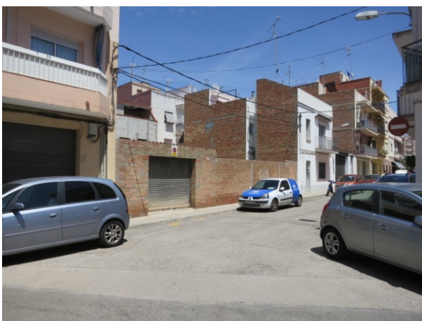
Gual preexistent a repintar