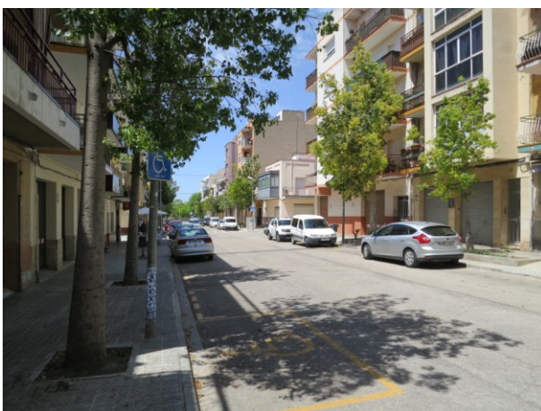
Plaça d'aparcament per a Persona amb Mobilitat Reduïda