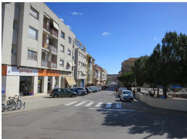
Vista del pas de vianants de la plaça Francesc Layret. Detall del mal estat de l'asfalt