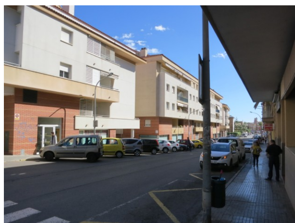
Zona de càrrega i descàrrega preexistent.