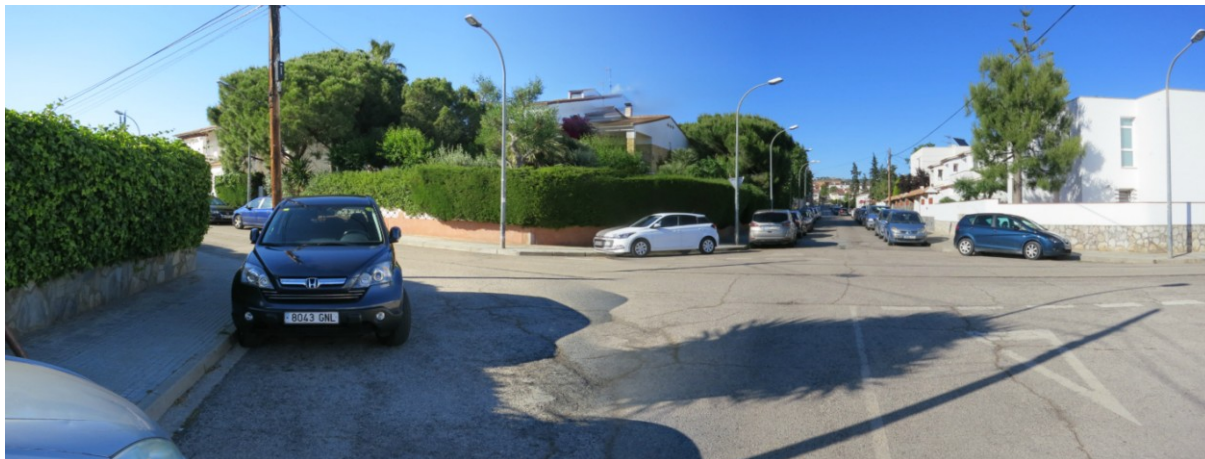
Cruïlla del carrer Pep Ventura amb el Carrer Bisbe Aguilera