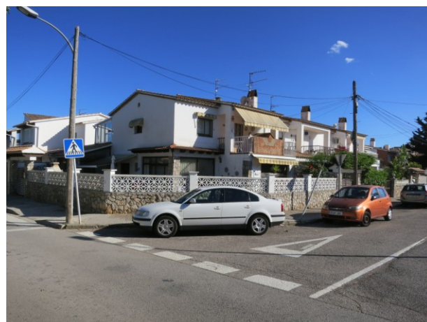
Cruïlla amb carrer de Sitges