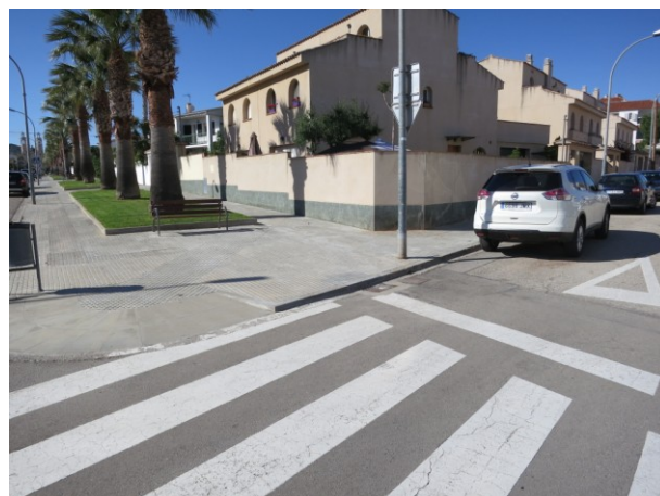
Ausiàs March cruïlla amb l'Av. Onze de setembre