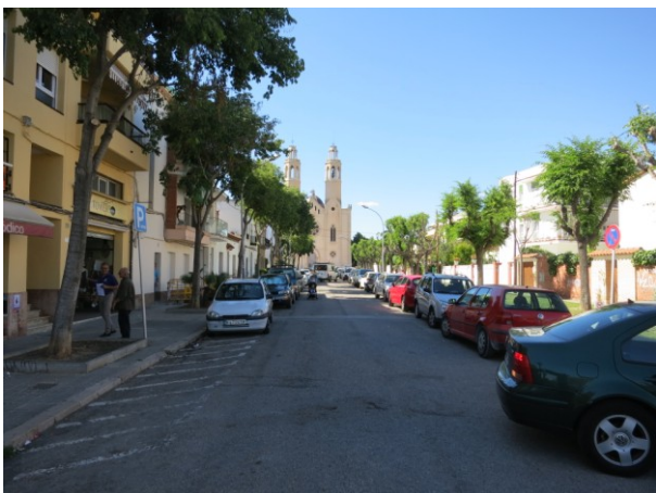
Vista des de la Plaça Catalunya