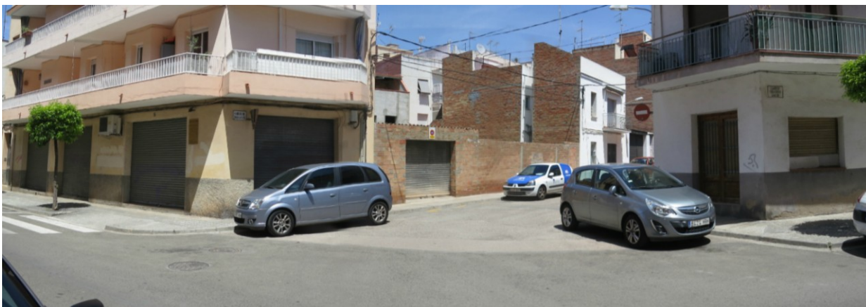
Vista des del carrer Antoni Gaudí