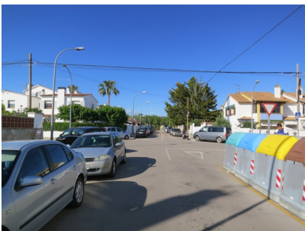
Senyals viàries grogues sota dels contenidors