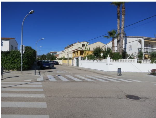
Cruïlla amb el Av. Onze de setembre