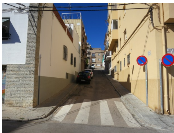
Recorregut a través del Carrer Sant Ramon en sentit Nord-Sud 3