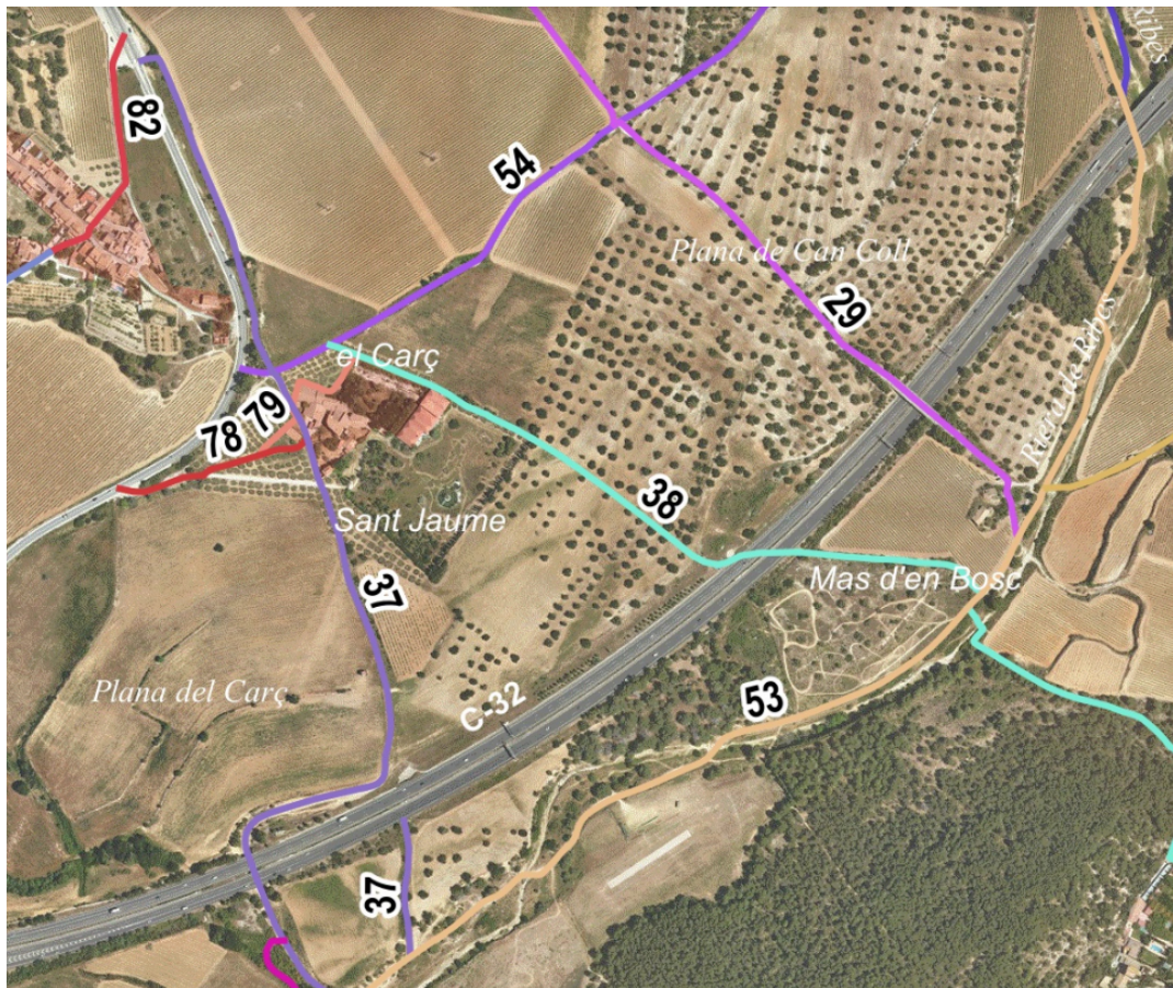
Extracte inventari de camins municipals de Sant Pere de Ribes