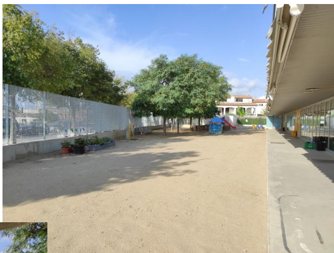
El pati actual