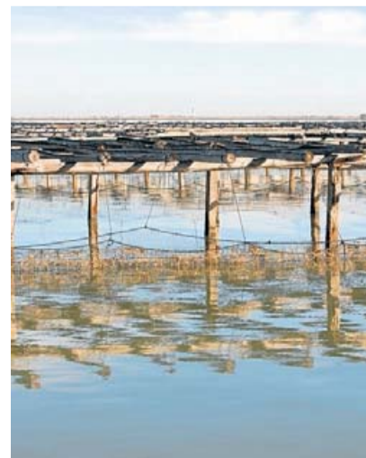
Una de les muscleres del Delta, en una imatge d'arxiu. TJEK VAN DER MEULEN

Els musclaires de la zona fa setmanes que recullen material inert de l'aigua i de les muscleres, explica Bonet a l'agència Efe, i avança que tot plegat encarirà el producte