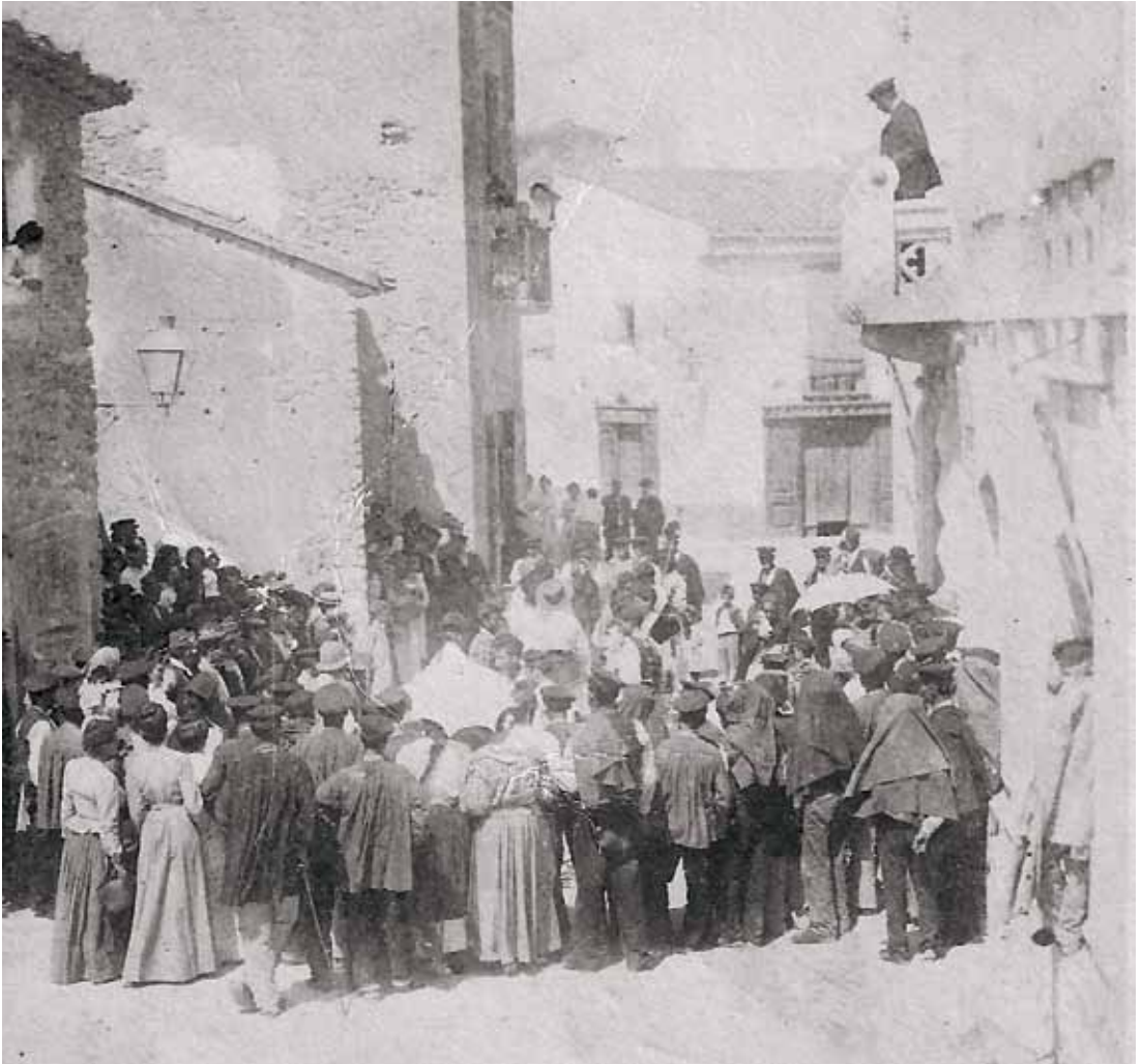
Segurament, la primera fotografia del ball de bastons a Ribes, feta cap al 1900 davant l'Ajuntament.