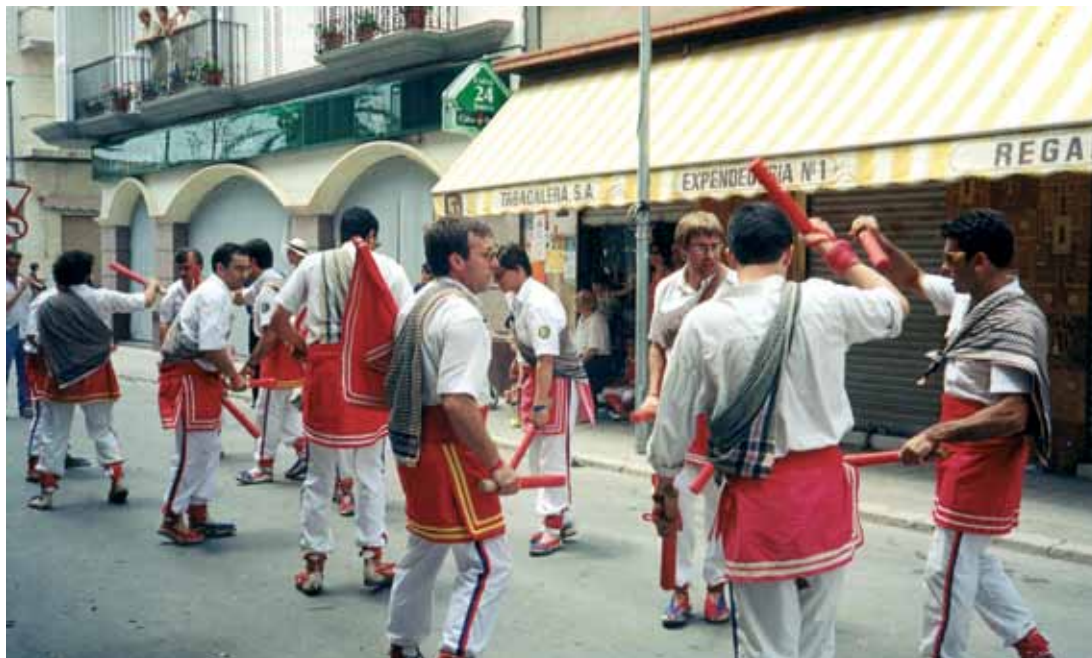
Família Roig Pascual