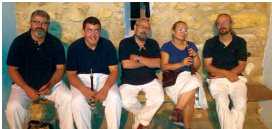
Grallers Entre vinyes

En les tasques de recuperació de les músiques antigues (2003), també ens van ajudar els músics Àngel Vallverdú, flabiolaire de Cambrils i un dels més grans coneixedors del ball de bastons i les seves músiques, i Blas Coscollar, metge, musicòleg i tot un erudit en qüestions de folklore.