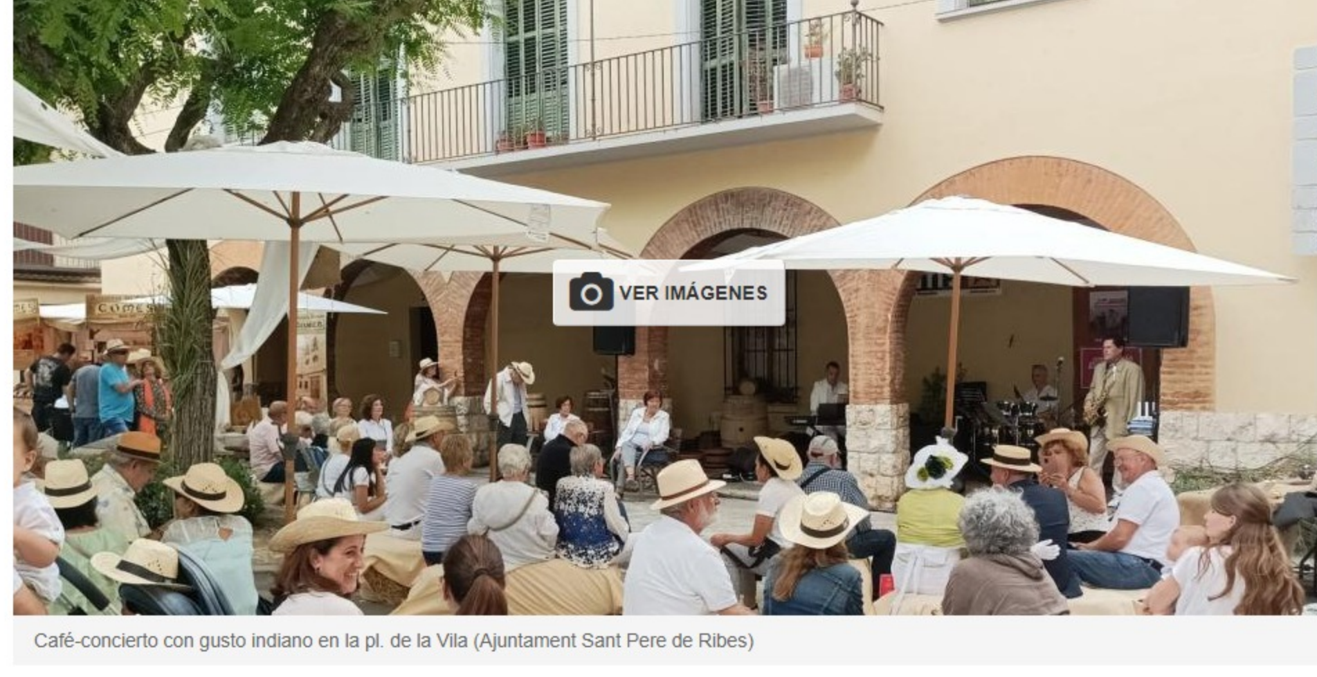
Café-concierto con gusto indiano en la pl. de la Vila (Ajuntament Sant Pere de Ribes)

• Un año más, Sant Pere de Ribes se viste de fiesta con el Retorn dels Indians y la Fira Agromercat