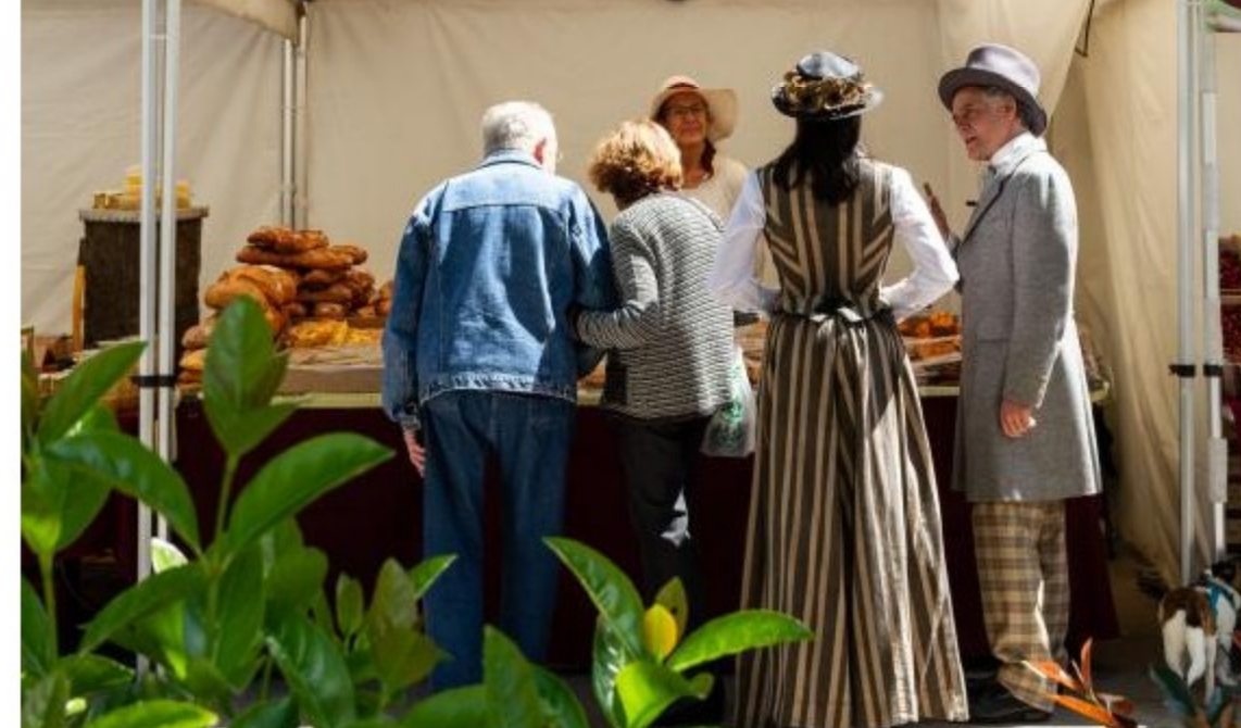
Feria Agromercat con productos de proximidad (Ajuntament de Sant Pere de Ribes)

El Retorn dels Indians de Sant Pere de Ribes es uno de los acontecimientos más relevantes que se hacen alrededor de la temática indiana en toda Cataluña. Sant Pere de Ribes forma parte de la Xarxa de Municipis Indians junto con municipios referentes como Begur, Arenys de Mar o Sitges, entre otros. La XMI apoya al Ayuntamiento en la celebración de algunas actividades como por ejemplo la Cata de vinos maridados con chocolate. Por otro lado, cada año tiene lugar la Conferència-tertúlia indiana, que en esta ocasión tratará el legado indiano, los edificios, desde las vivencias, de las luces y sombras de aquella época, etc. A continuación, contaremos con una interesante intervención por parte del Redós, con la que nos transportarán a los inicios de su creación como edificio al servicio y atención de las personas. Todo ello, en línea con la temática indiana de este año que pone de manifiesto la importancia de mantener vivo el patrimonio y su vinculación con las personas, los recuerdos y las vivencias.