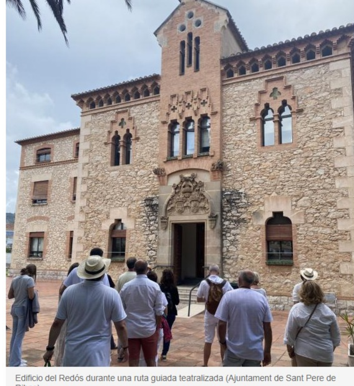
Edificio del Redós durante una ruta guiada teatralizada (Ajuntament de Sant Pere de Ribes)

Las rutas guiadas teatralizadas de los americanos recorrerán los principales lugares del municipio con gusto indiano con la posibilidad de acceder en espacios como la capilla del Redós de Sant Josep y Sant Pere y el Salón de plenos de la Casa de la Vila, entre otros de otros lugares.