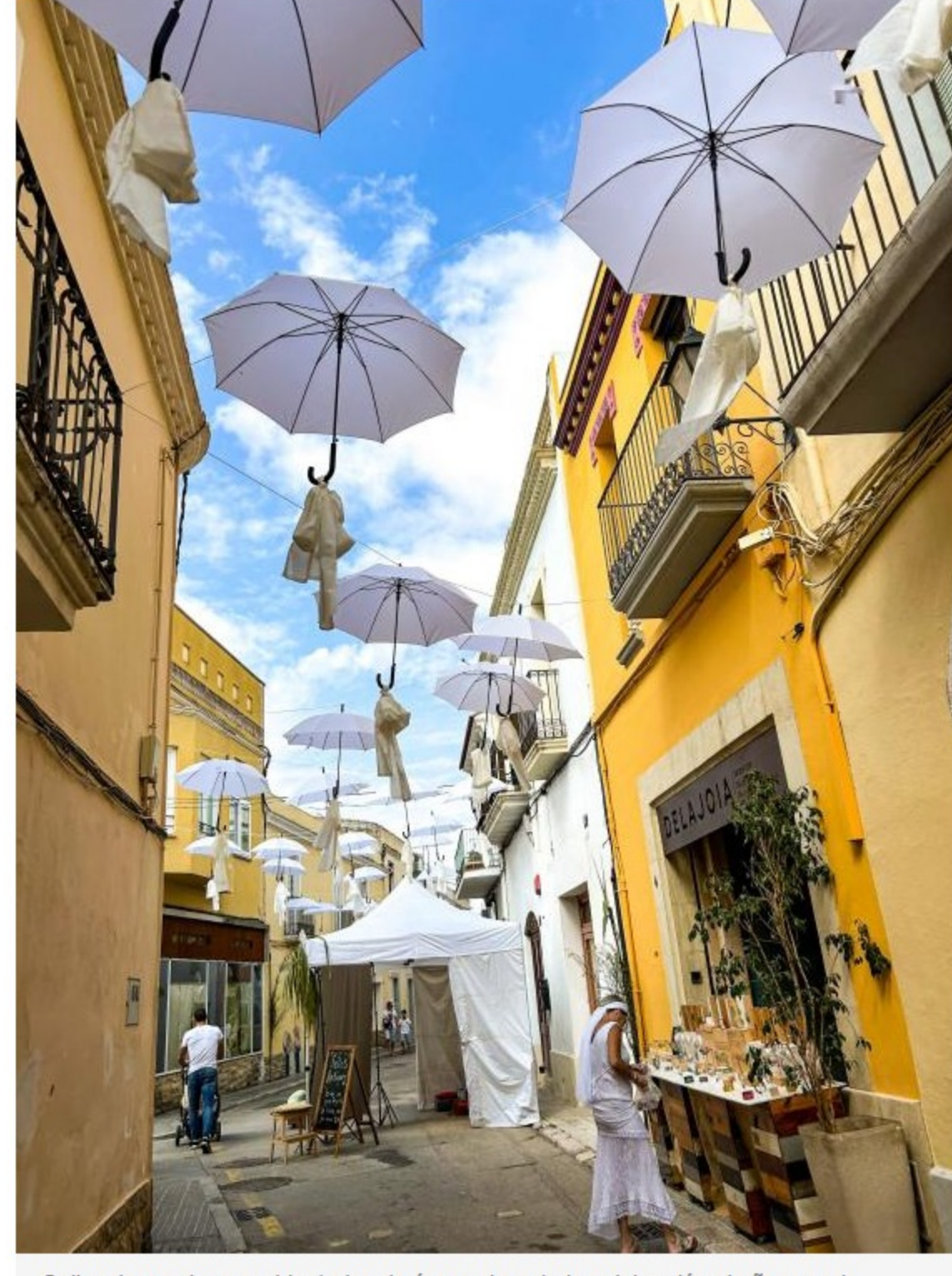
Calle decoradas y ambientadas de época durante la celebración el año pasado

Otro de los espacios será la plaza de la Font, que enlaza por un lado con el photocall , por la otra, con el espacio de artesanías locales de la mano de la entidad DO Ribes. En la plaza de la Font, envuelta con música y decoración, la fiesta estará asegurada con la actuación de grupos de música cubana, cuenta-cuentos por los más pequeños y exhibiciones de salsa y bailes cubanos y con degustación de mojitos y cócteles típicos indianos.